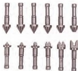
Сменные пятки/ наконечники микровинта в парах